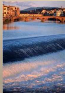
フィレンツェアルノ川