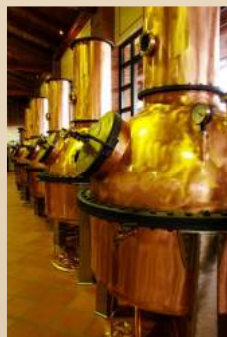
ベルタの蒸留装置