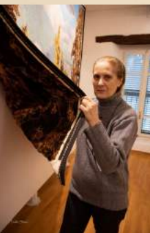
アスティの絨毯工房