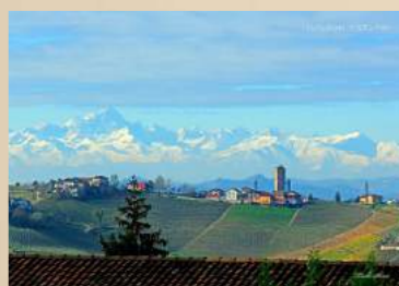
バルバレスコと葡萄畑