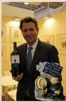
サルバトーレ・フェラガモ氏