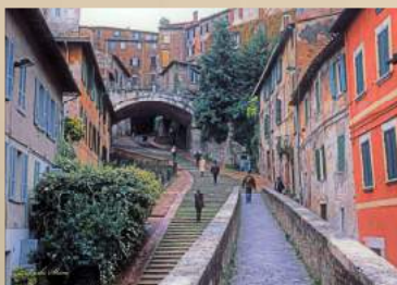
ペルージャの水道橋通り