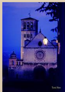
聖フランチェスコ大聖堂